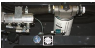
Réservoir d'huile hydraulique incorporé au châssis

Le CARRY 107 est un mini-transporteur hydrostatique compact. Il est équipé d'un circuit hydraulique auxiliaire permettant d'ajouter des accessoires hydrauliques. Le montage de la benne est simple. Il est également possible de remplacer la benne par d'autres accessoires (autres modèles de bennes; petites bétonnières ...). Il existe en 2 versions : Essence avec moteur HONDA GX 270 6.3 kW, ou version Diesel avec moteur YANMAR L100 7.4 kW.